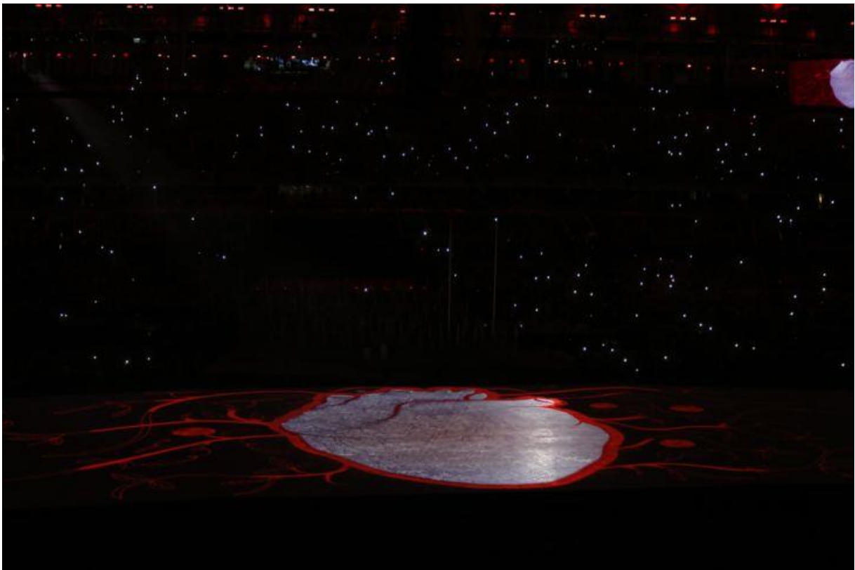
Az emberi szívet ábrázoló puzzle

Carlos Arthur Nuzman, a szervezőbizottság elnöke köszöntőjében úgy fogalmazott: az emberek különbözőképpen nézhetnek ki, de egyforma a szívük. „Az egyenlőség nevében vagyunk ma itt. Ti, sportolók inspiráltok bennünket a szenvedélyességetekkel. Szuper emberek vagytok, akik tudják, hogy nincs lehetetlen" – mondta beszédében, amelyben külön köszöntötte a paralimpián tevékenykedő önkénteseket.