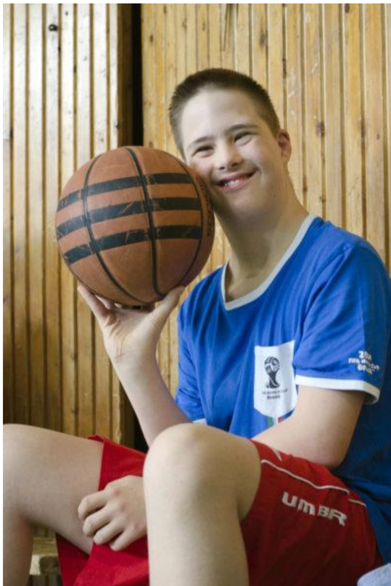
Marci hetente kétszer jár kosárlabda edzésre