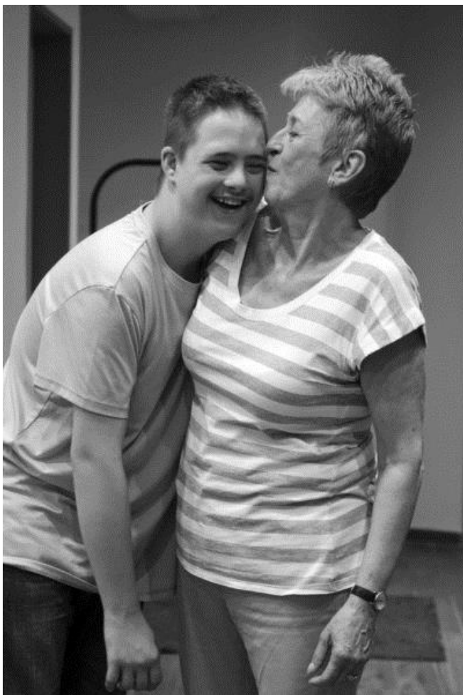
Édesanyja számára nem várt, késői ajándék fia